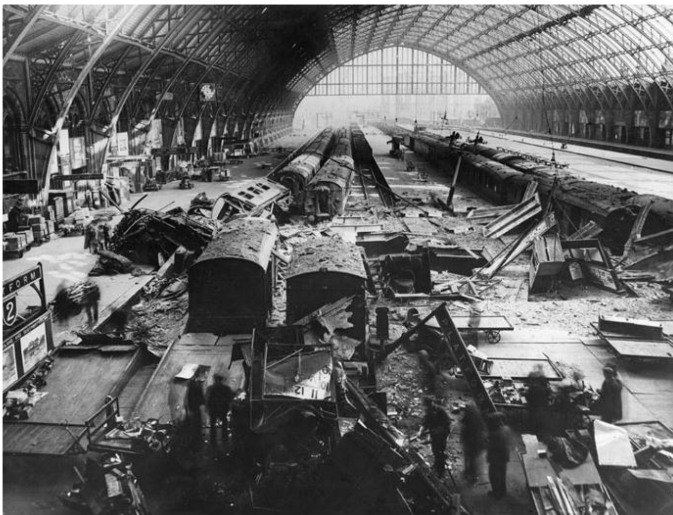
Kulturmøde: St. Pancras Railway Terminal blev ramt af en tysk bombe under Blitzten i maj 1941.